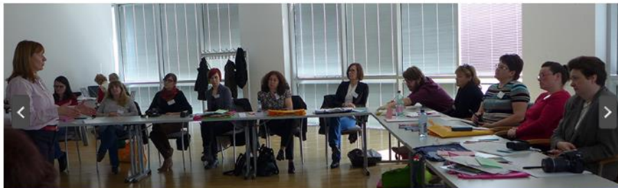
The workshop - 20-24 April, Linz, Austria